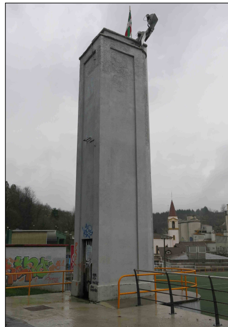
Egilea eta data: Juan Dominguez; 1946