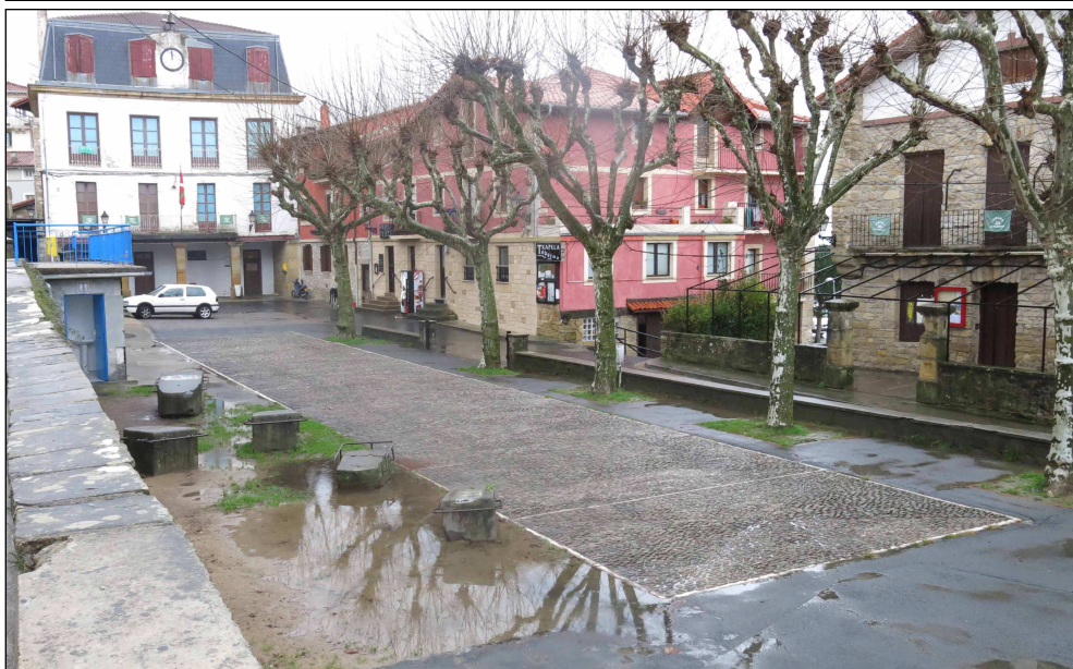
Egile eta data ezezagunak