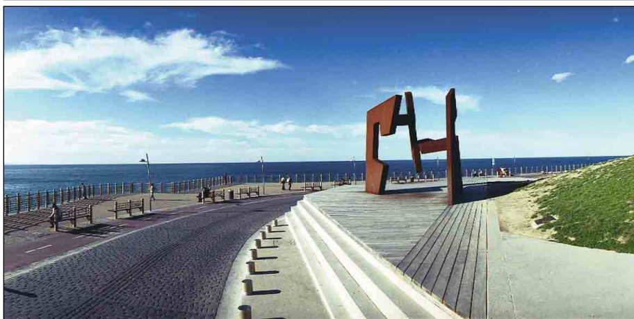
Egilea eta data: .....; 1957-2002.