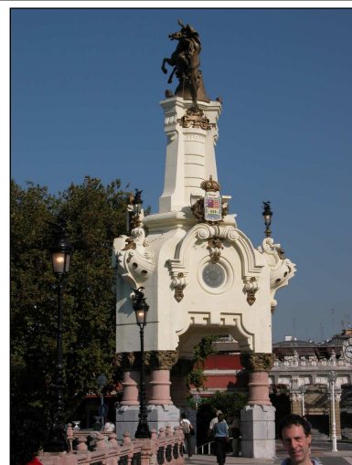
Egileak eta data: Jose Eugenio Rivera eta Julio M. Zapata; 1903