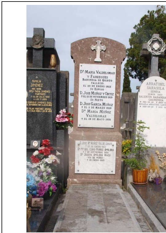
Imagen de la sepultura