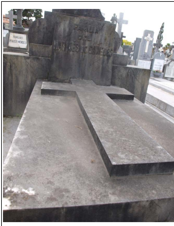
Imagen de la sepultura