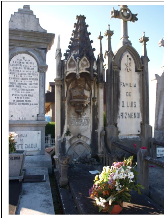
Imagen de la sepultura