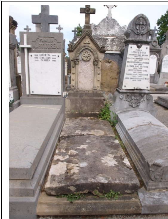
Imagen de la sepultura