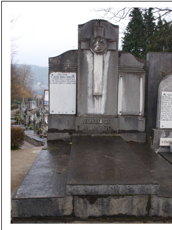
Imagen de la sepultura