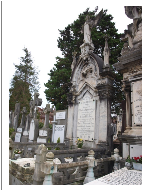
Imagen de la sepultura