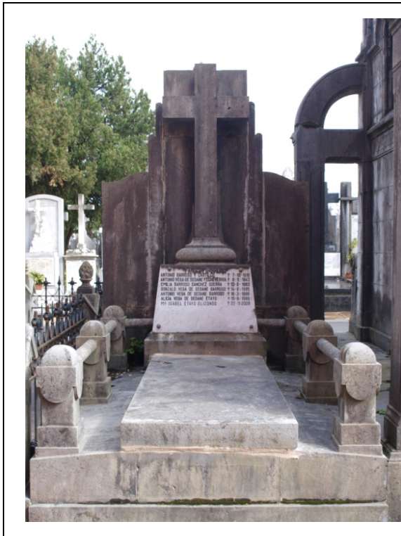
Imagen de la sepultura