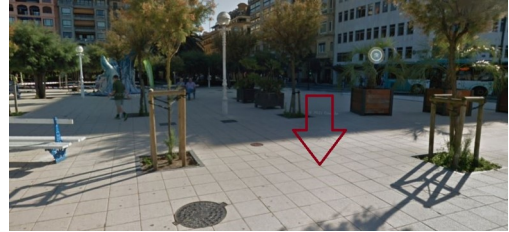
P02: Alderdi Eder