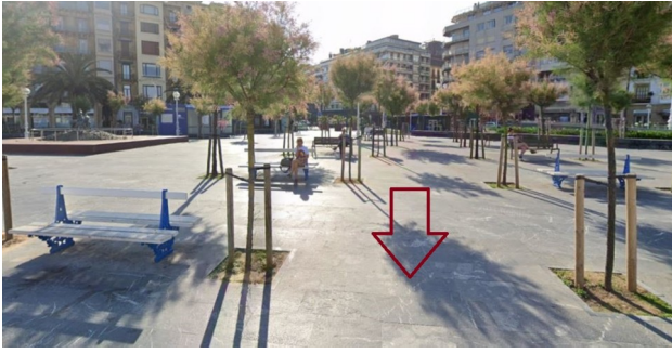
P09: Cervantes Plaza