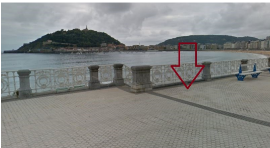
P07: Kontxa Pasealekua