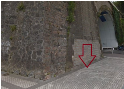
P05: Ondarreta Tunela