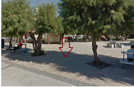
P01: Alderdi Eder